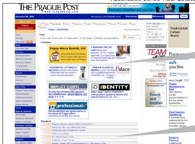
Vizualizace sekce Real Estate